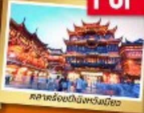
ศาลาร้อยปีปักกิ่งหวงเหมียว