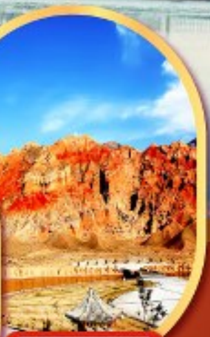
หุบเขาห้าสี อุทยานธรณีกุยเต๋อ