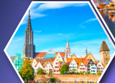
อูล์มบ้านเกิดไอน์สไตน์