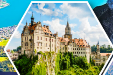
ปราสาทชีกมารังเก็ม