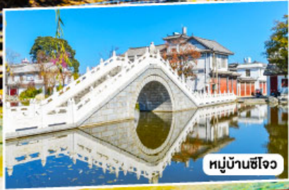
หมู่บ้านซีโจว