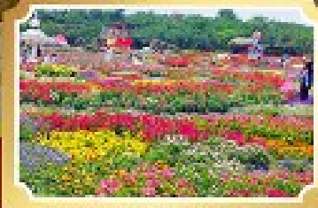
สวนสวรรค์ดอกไม้สีฤดู Wenhua Mirror