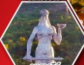
อนุสาวรีย์