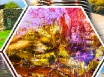
ด้าไฟรมีริอุส