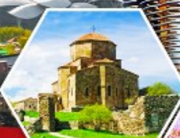
วิหารจอร์ยี