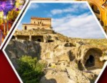
เมืองด้าอพลิสตีซึเคห์

แพ็คเกจ Rooms Hotel โรงแรมวิวทิวทัศน์ของเทือกเขาคอเคซัส