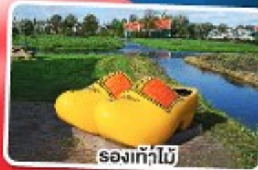
รองเท้าไม้