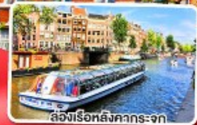
ล่องเรือหลังคากระจก