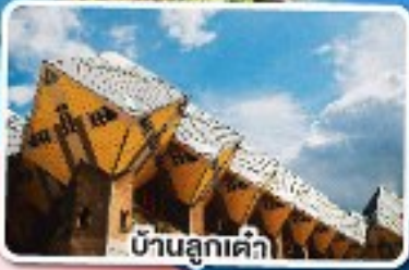
บ้านลูกเต้า