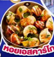
หอยแอสคาร์โท

เดินทาง 17-25 ก.ย.67/11-19,18-26 ต.ค.67 14-22 พ.ย.67/30 พ.ย.-8 ธ.ค.67 25 ธ.ค.67 - 2 ม.ค.68(เทศกาลปีใหม่)