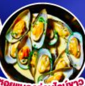
หอยแมลงภู่อบไวน์ขาว