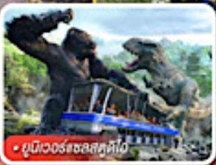
ยูนิเวอร์แซลส์ตูดิโอ