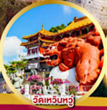
วัดเหวินหู่