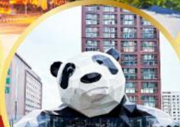
หมีแพนด้าปิ่นตึก