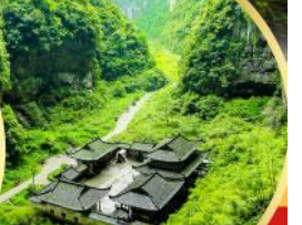
หลุมฟ้าสะพานสวรรค์