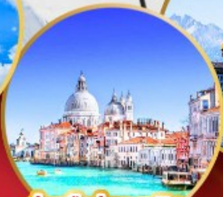
ล่องเรือสู่เกาะเวนิส