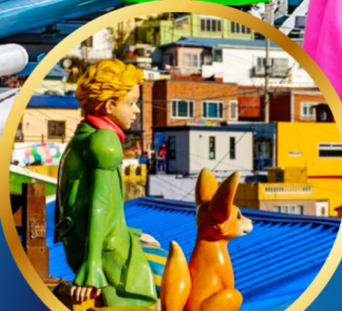
หมู่บ้านวัฒนธรรมคิมซอน