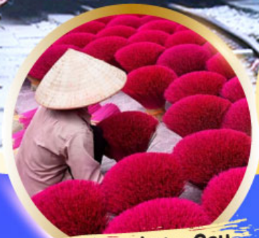
หมู่บ้านรูป Phu Cau