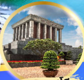
สุสานลุงโฮ