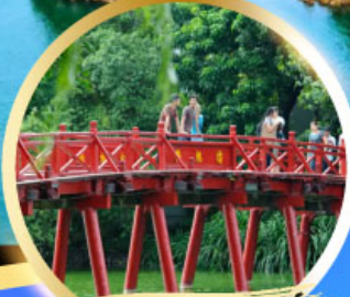
สะพานแสงอาทิตย์