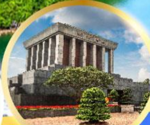
สุสานลุงโฮ