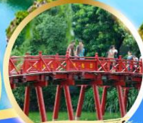
สะพานแสงอาทิตย์