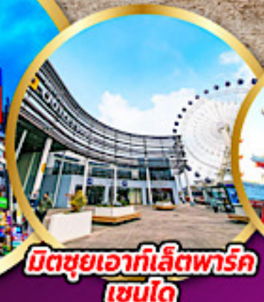
มิตซูฮิเอากะไลท์พาร์ค เซนได