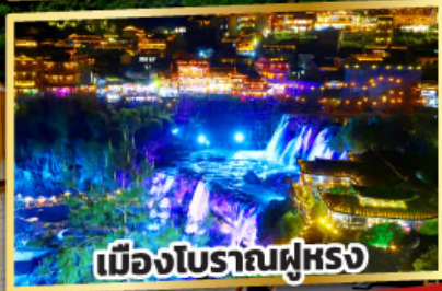
เมืองโบราณฟูหรง