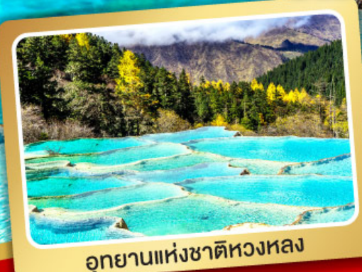
อุทยานแห่งชาติหวงหลง