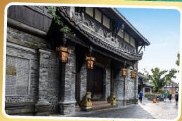
ถนนควานโจ๋เซียงจื่อ