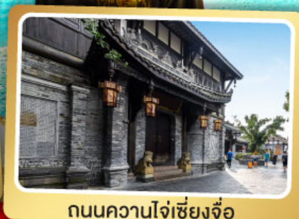
ถนนควานโจเซียงจื่อ