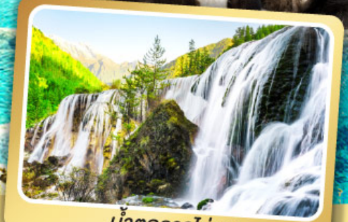
น้ำตกธารไข่มุก

ชมโชว์เปลี่ยนบุหน้ากาก เมนูพิเศษ สุกัหมาลำซองวน