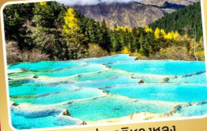
อุทยานแห่งชาติหวงหลง