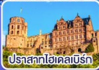
ปราสาทไฮเดิลเบิร์ก