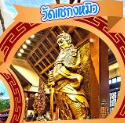
วัดชางนวย