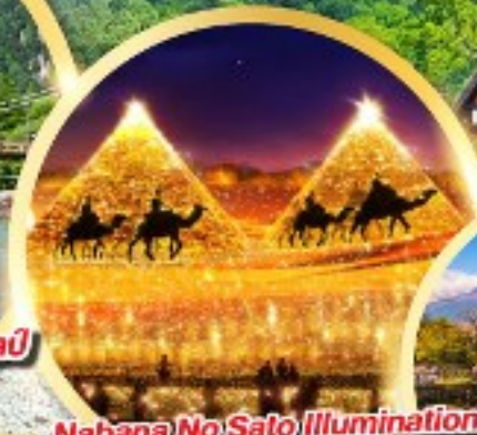
Nabana No Sato Illumination