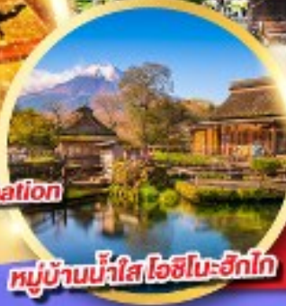
หมู่บ้านน้ำใส โอชิโนะฮัทสึ