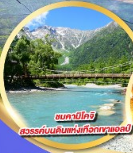
ชมคาบิโกจิ

นั่งกระเช้าลอยฟ้า 2 ชั้น ชินโฮทากะ หนึ่งเดียวในญี่ปุ่น แลนด์มาร์กยอดฮิตของโอคุซิดะ