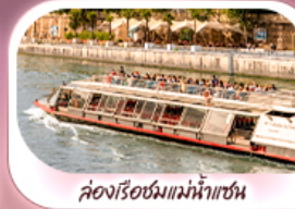
ล่องเรือชมแม่น้ำแซน