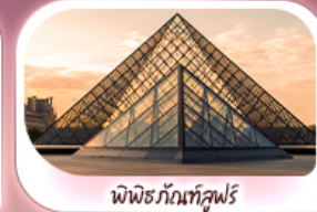
พิพิธภัณฑลุลูฟร์