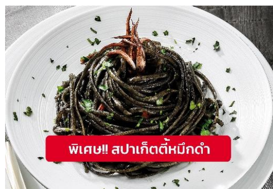
พิเศษ!! ส�파เก็ตตี้หมีดำ

Highlight! เมื่อเยือนเกาะเวนิส เมนูที่ขึ้นชื่อและหากได้มาต้องได้ลิ้มลองสปาเก็ตตี้ผัดซอสหมีดำที่คลุกเคล้ากับความหอมนุ่มนัวกับบรรยากาศ สุดคลาสสิคฉบับอิตาเลียนต้นตำรับเวนิส