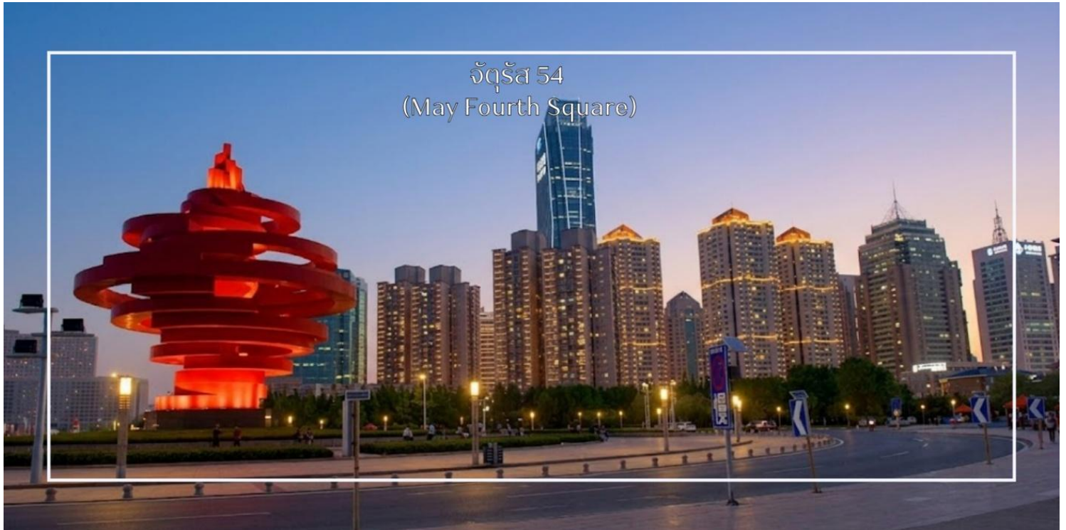
จัตุรัส 54 (May Fourth Square)

จากนั้นนำท่านสู่ จัตุรัส 54 (May Fourth Square) แลนด์มาร์กสำคัญริมชายฝั่งทะเลของเมืองชิงเต่า โดดเด่นด้วยประติมากรรมเรือใบสีแดงสูงตระหง่าน ที่เป็นสัญลักษณ์ของเมือง พร้อมพื้นที่กว้างขวางสำหรับเดินเล่น ชมสวนดอกไม้ และถ่ายภาพบรรยากาศทะเลอ่าวชิงเต่า จัตุรัสแห่งนี้เป็นจุดพักผ่อนยอดนิยมและศูนย์กลางกิจกรรมสำคัญของเมือง