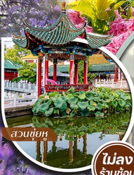
สวนชู่ยู่