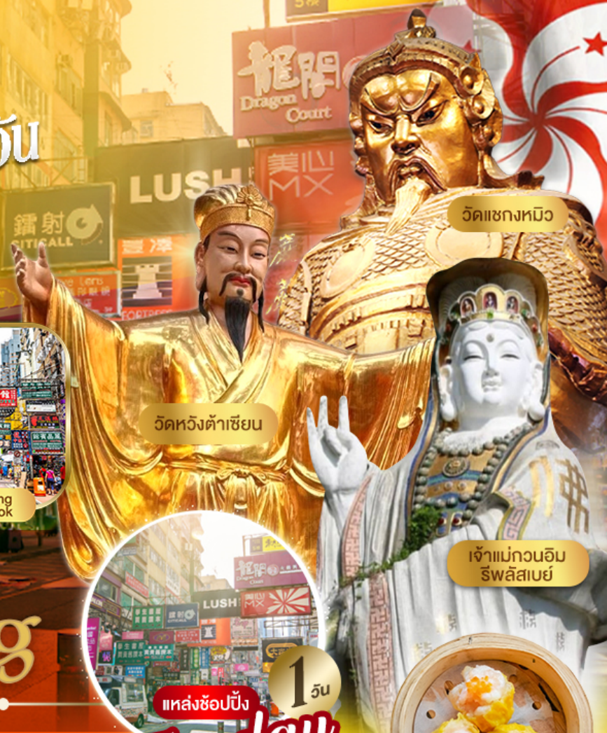
วัดแซงหมิว