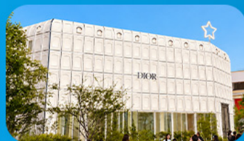
บรูคลินเกาหลี่