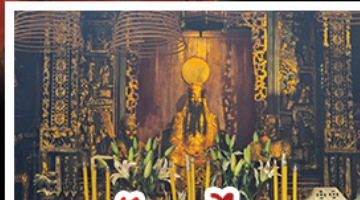
วัดกวนหนี่ท