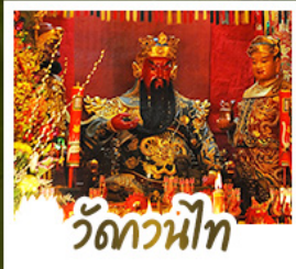
วัดกวนนิต