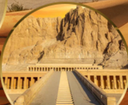
หุบเขากษัตริย์