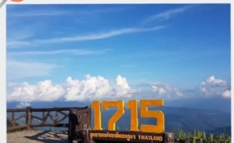
จุดชมวิวที่มีความสูง 1715