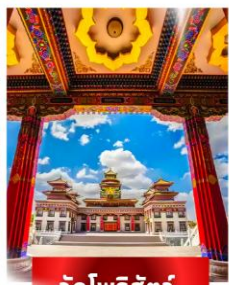
วัดโพธิ์สัตว์