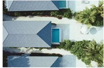
Mabin Beach Pool Villa