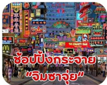
ช้อปปิ้งกระจาย "จิมซาจุ่ย"