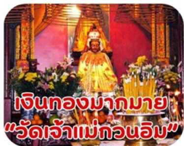
เงินทองมากมาย "วัดเจ้าแม่กวนอิม"