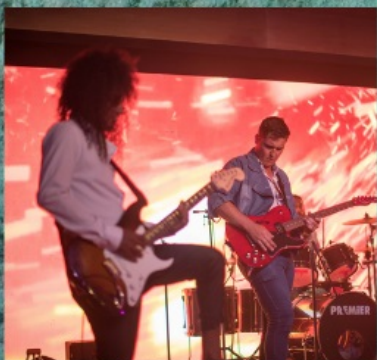
Hard Rock Cafe