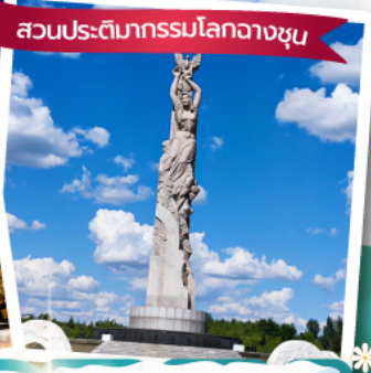
สวนประติมากรรมโลกวางซุน