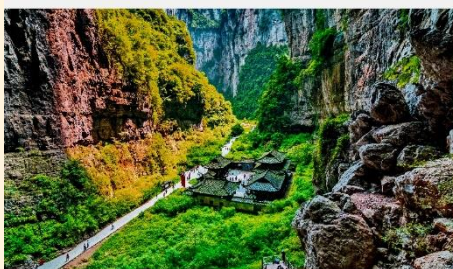
อุทยานแห่งชาติหลุมฟ้า 3 สะพานสวรรค์