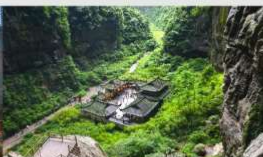
หลุมบ่อฟ้า