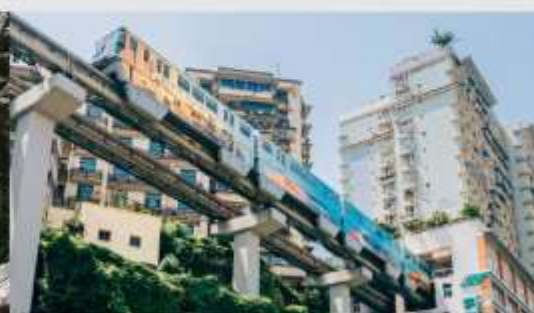
รถไฟฟ้าทะลุตึก