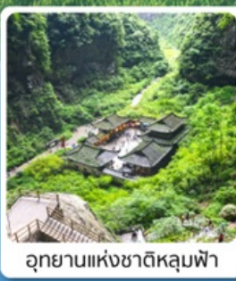
อุทยานแห่งชาติหลุมฟ้า

เดินทาง เมษายน - มิถุนายน 2569 ราคาเริ่มต้น 15,888