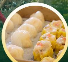
ตี๋มซ่าฮ่องกง