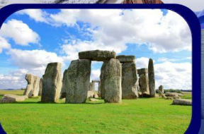
เข้าชมสโตนเฮนจ์