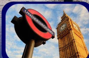
มหานครลอนดอน