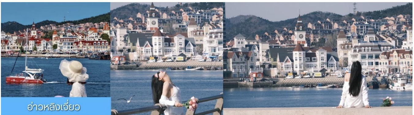
อ่าวหลังเจียว

จากนั้นนำท่านเที่ยวชม ทำเรือประมงหู่ทาน 大连渔人码头 เป็นจุดเช็คอินที่โดดเด่นด้วยสถาปัตยกรรมสไตล์ยุโรปสีสันสดใส ผสมผสานกลิ่นอายเมืองท่าดั้งเดิมเข้ากับบรรยากาศสุดโรแมนติคที่เต็มไปด้วยเรือประมง คาเฟ่ ร้านอาหาร และจุดชมวิวยริมหาด