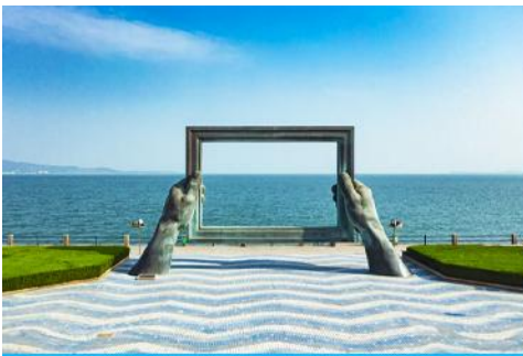
กรอบรูปวิวกทะเล