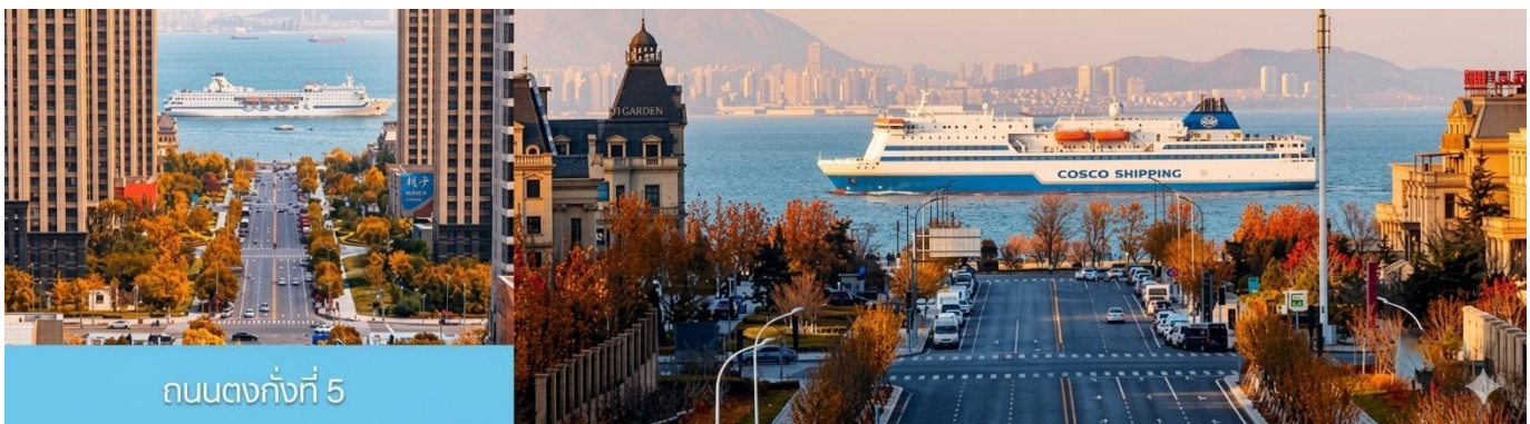
ถนนกั๋งตงที่ 5