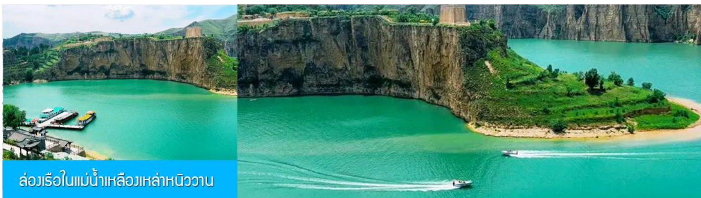
ล่องเรือในแม่น้ำเหลืองหล่าหนิววาน

รับประทานอาหารกลางวัน ณ ร้านอาหารระหว่างทาง (8)