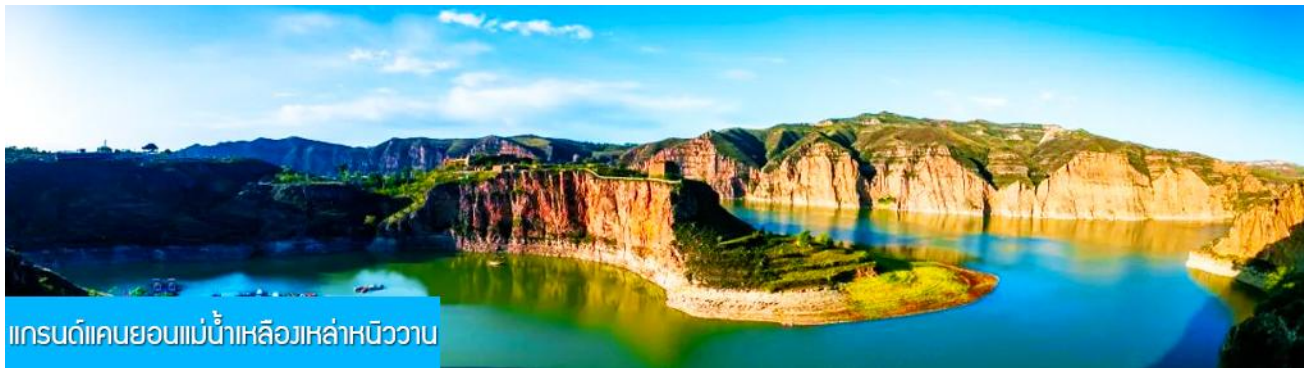
แกรนด์แคนยอนแม่น้ำเหลืองหล่าหนิววาน

พักที่ DALATEQI SHNAGJING HOTEL โรงแรมระดับ 4 ดาวหรือเทียบเท่าในเมืองต้าลาเพื่อ