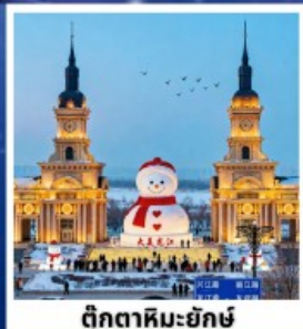
ตึกตาสหิมะยักษ์