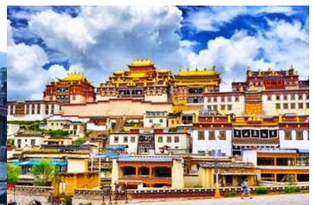
เมืองเซงการีล่า