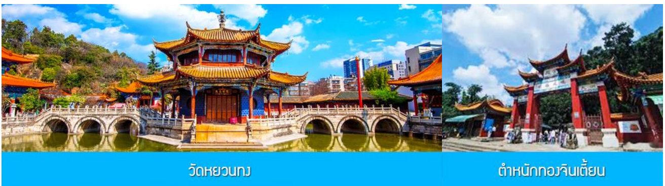
วัดหยวนทง

พักที่ VIENNA HOTEL ระดับ 4 ดาว หรือเทียบเท่าในเมืองคุนหมิง