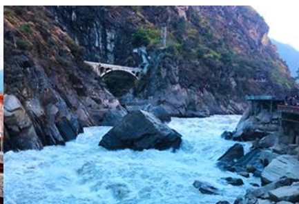
ช่องแคบเสื่อกระโจน