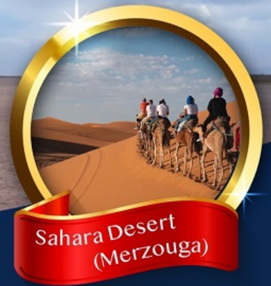
Sahara Desert (Merzouga)