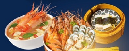
อาหารไทย จีน Seafood

เปิดประสบการณ์อนันต์ดาวสุดฟิน กลางทะเลทรายซาฮารา "Luxury Camp"