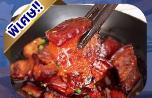
เมนูหมูสามชั้นตุ๋นน้ำแดง

พักโรงแรม 4 ดาว ★★★★★ ฟรี ประกันอุบัติเหตุ บริการอาหารท้องถิ่น