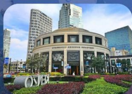
สตาร์บิกใหญ่ที่สุดในเอเชีย