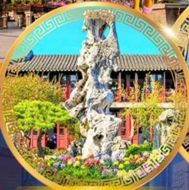
สวนหลิวหยวน

ถนนหนานจิงหลู่ หาดไว่ทาน ชมหอไข่มุก ล่องเรือทะเลสาบซีหู ตำนานพญางูขาว เจดีย์เหลยเฟิง ถนนเลี้ยวเหอจื่อเจีย วัดหลงหยวน สวนหลิวหยวน ซุปปิ้ง ถนนกวนเจียนเจีย ถนนซีหลี่ซานถึง วัดพระหยก เซคอินย่านเก่าซิ่นเทียนตี้ สักการะศาลเจ้าพ่อหลักเมือง