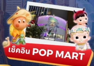
เบ็คอิน POP MART