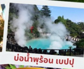
บ่อน้ำพุร้อน เปรปุ

หมู่บ้านยูฟูอินฟลอร์ริล ทะเลสาบคินริน ทะเลสาปคินริน บ่อน้ำพุร้อน อุมิจิโกกุ ท่าเรือโมจิโกะ เรโร ตลาดปลาคาราโตะ ศาลเจ้ามียาจิดาเกะ ดิวัตตีฟรี ฟุกุโอกะ เบย์ พลาซ่า ช้อปปิ้งออน มอลล์ หิ้งคูเมโอโตะอิวะ ชมดอกไม้ไฮเดรนเยีย รอนน้ำตกชิราอิโตะ ช้อปปิ้งย่านเท็นจิน