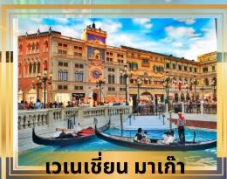
เวเนเซียน มาเก๊า