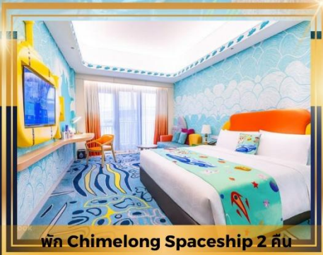
พัก Chimelong Spaceship 2 คืน