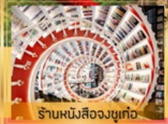
ร้านหนึ่งสี่องซูเก๋