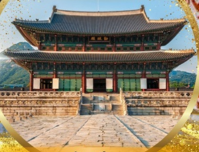
พระราชวังเคียงบกกุง

EASTAR JET เดินทาง 이스타항공 พฤศจิกายน 2567 น้ำหนัก 20 Kg. Carry on 10 Kg.