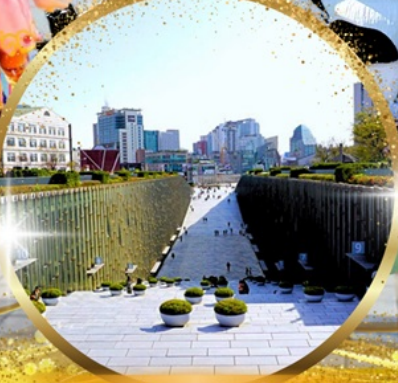
มหาลัยหญิงอีวา